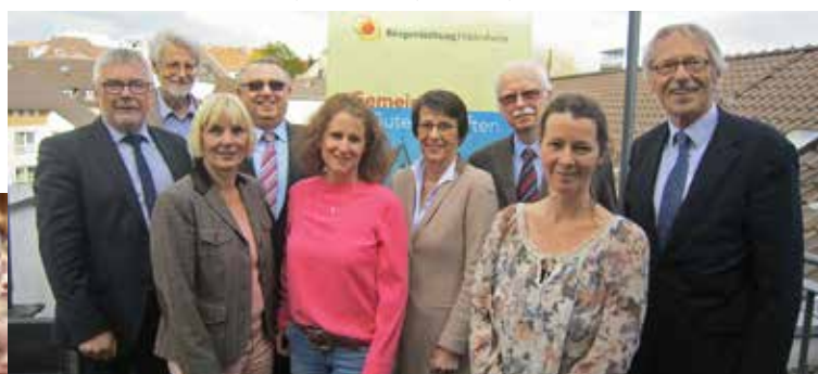
Vorstand und Stiftungsrat der BürgerStiftung Hildesheim